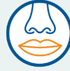
Ekāāl im ejellok nemen ak bwiin jabdewōt