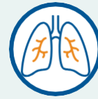
Kajjinōk ak abañ an emenono