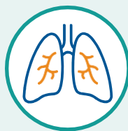
Falta de aire o dificultad para respirar