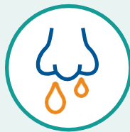
Congestión o secreción nasal