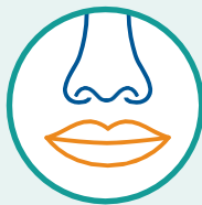
Pérdida reciente del gusto o el olfato