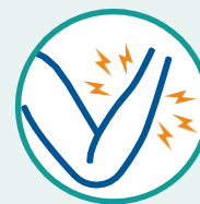
Dolores musculares o corporales