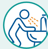
Náuseas o vómitos