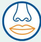
လတ်တလော အနံ့ သို့မဟုတ် အရသာ ပျောက်ဆုံးခြင်း