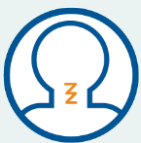
လည်ချောင်းနာခြင်း