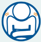
ချမ်းစိမ့်စိမ့်ဖြစ်ခြင်း