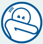
ချောင်းဆိုးခြင်း