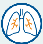
အသက်ရှူကျပ်ခြင်း သို့မဟုတ် အသက်ရှူရခက်ခဲခြင်း