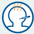
ဖျားခြင်း