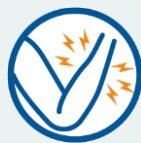
ကြွက်သားကိုက်ခဲခြင်း