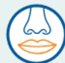
미각 또는 후각 저하가 나타남