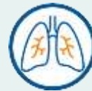
숨참 또는 호흡 곤란