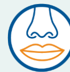
Perte de goût ou d'odorat récente