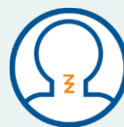
Mal de gorge