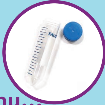
Ujummoo ittiin fuutan