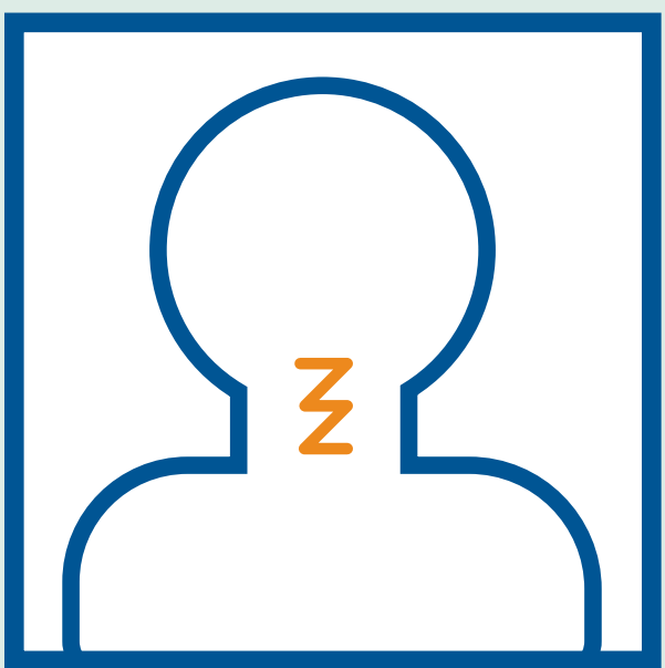
Біль у горлі