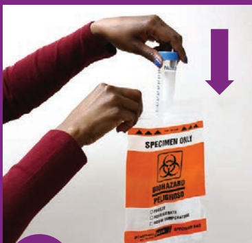
8 ቱቦውን የፕላስቲክ ቦርሳ ውስጥ ያስቀምጡት