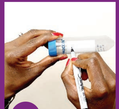
7 ቱቦውን በስም እና በቀን ይሰይሙት