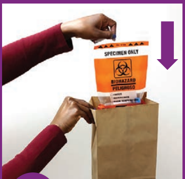
9 የፕላስቲክ ቦርሳውን የወረቀት ቦርሳ ውስጥ ያስቀምጡት