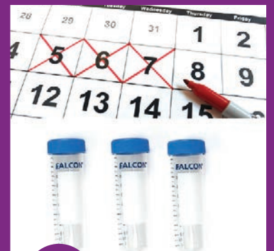
11 ለ 3 ተከታታይ ቀናት በቀን 1 ቱቦ ይሰብስቡ