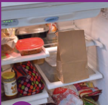
10 የወረቀት ቦርሳውን ፍሪጅ ውስጥ ያስቀምጡት