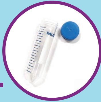
Cjevčicu za prikupljanje