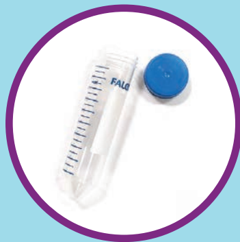
Tuba za sakupljanje