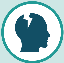
Maumivu ya kichwa