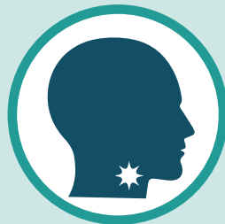
Maumivu ya koo