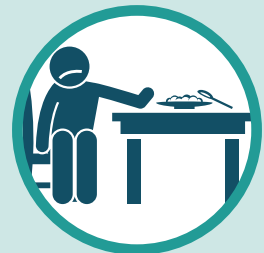
Kupoteza uwezo wa kuhisi ladha ya kituau kunusa