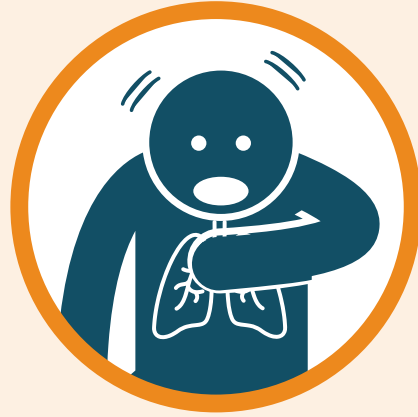
Kushindwa kupumua au ugumu wakati wa kupumua