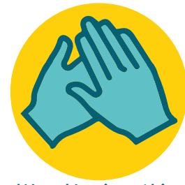
搓至乾 (20 秒)