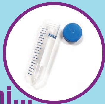
Posuda za uzorke