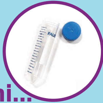
Posuda za uzorke