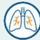
Txog siav los sis muaj kev ua pa nyuaj