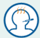
Kub taub hau