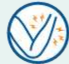
Mob cov leeg nqaij