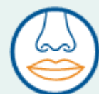
Tsis hnov qab los los sis tsis hnov ntshiab zoo tshiab