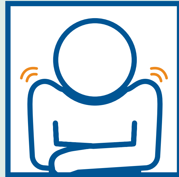
Ua daus no