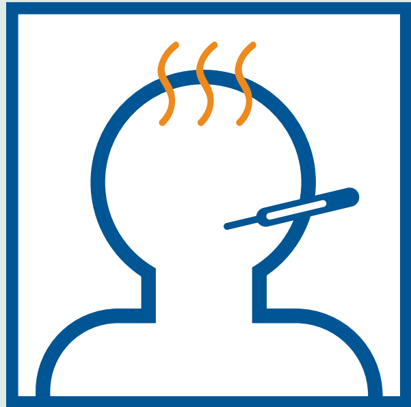
Kub taub hau

Hu rau koj tus kws kho mob yog koj muaj ib ntawm cov yeeb yam mob no: