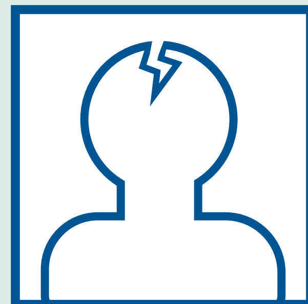
Mob taub hau