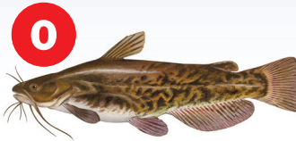
Ntses Brown Bullhead