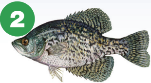
Ntses Black Crappie (los sis 4 pluag, yog noj ib thooj nqaij ntshiv xwb)