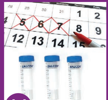
11 Khaws 1 raj cug kom tau rau 3 hnuv ua ke