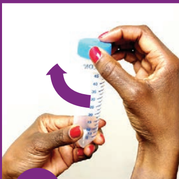
6 Muab lub hau kaw rau raj cug