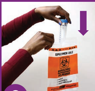
8 Muab raj cug ntim rau hauv hlab yas