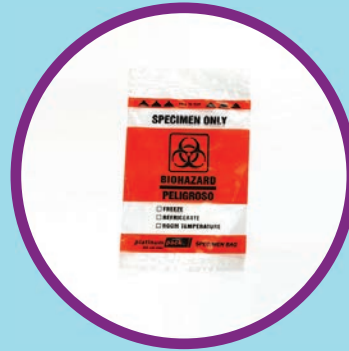
Ib hlab yas