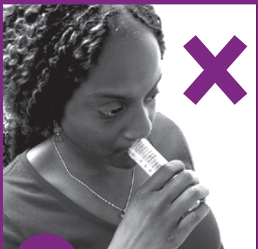
5 Tsis txhob cia koj lub qhov ncauj chwv raj cug