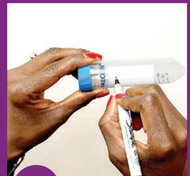
7 Sau koj lub npe thiab hnuv tim rau raj cug