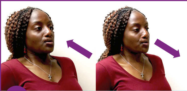
2 Nqus 3 pa hlob hlob