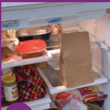
10 Tso lub hlab ntawv hauv tub yees