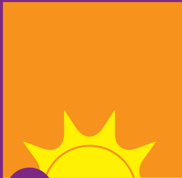
1 Tsim los