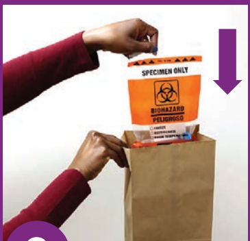
9 Muab lub hlab yas tso hauv lub hlab ntawv