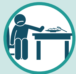
ຫາກໍສູນເສັງການ ຮັບກິນ ຫຼືລົດຊາດ