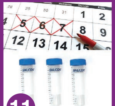
11 ຖິ້ມຂໍ້ກະເທີໃສ່ 1 ຫຼອດຕໍ່ມື້ເປັນເວລາ 3 ມື້