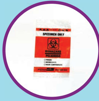
ຖົງປລາສຕິກ