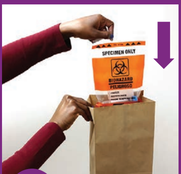
9 将塑料袋置于纸袋内