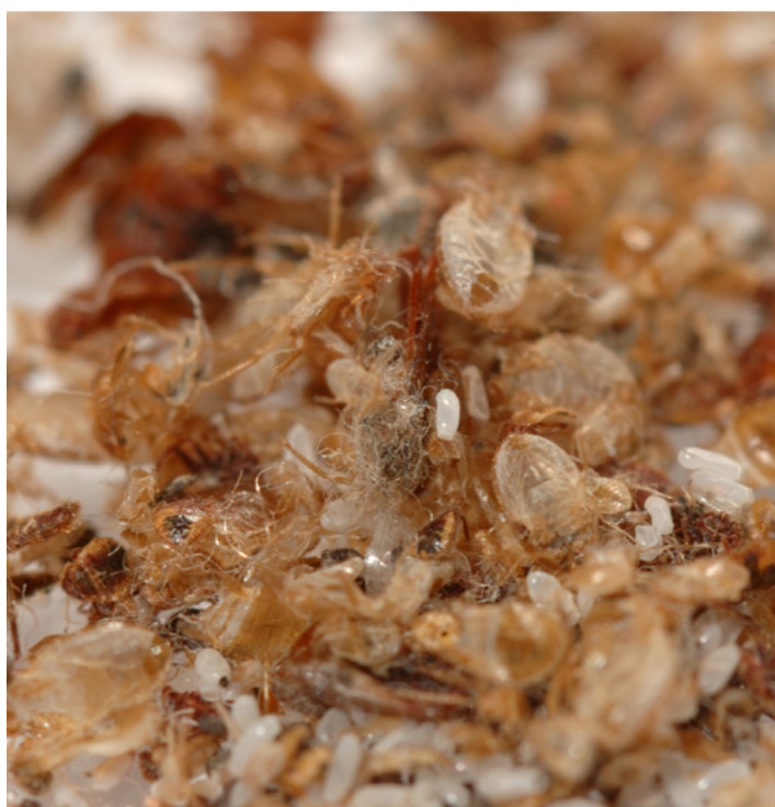
Линька постельных клопов