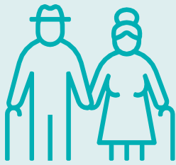
Старше 65 лет

Некоторые люди подвержены повышенному риску тяжелого протекания COVID-19.