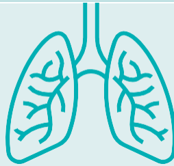
Хроническое заболевание легких