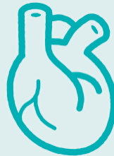
Хроническое заболевание сердца