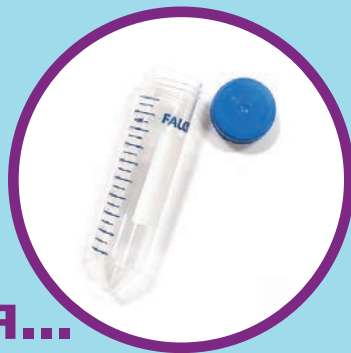
Контейнер для сбора мокроты