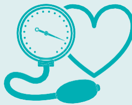
Presión arterial alta