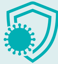
Sistema inmunitario comprometido

(p. ej., cáncer o tratamientos que suprimen al sistema inmunitario)