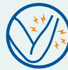
Dolores musculares o corporales