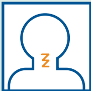
Dolor de garganta