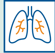
Falta de aire o dificultad para respirar