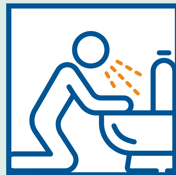
Náuseas o vómitos