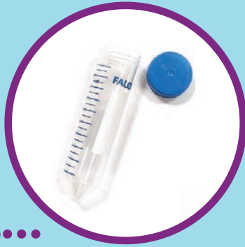
Un tubo de recolección