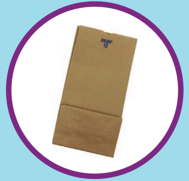
Una bolsa de papel