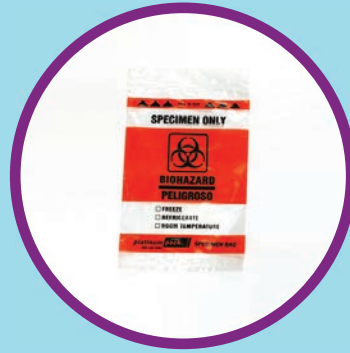
Una bolsa de plástico