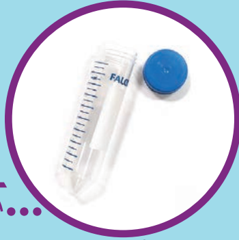
सङ्कलन गर्ने ट्युब