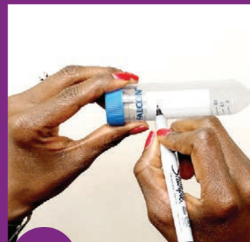
7 မြွန်ပေါ်တွင် အမည် နှင့်ရက်စွဲတို့ ရေးပါ