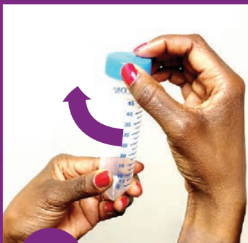
6 မြွန်အဖုံးကို လှည့်၍ပိတ်ပါ