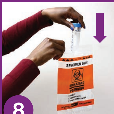
8 မြွန်ကို ပလတ်စတစ် အိတ်တွင် ထည့်ပါ