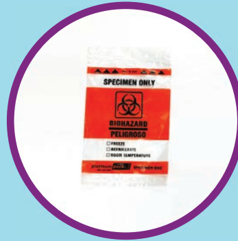
ပလတ်စတစ်အိတ်တစ်လုံး