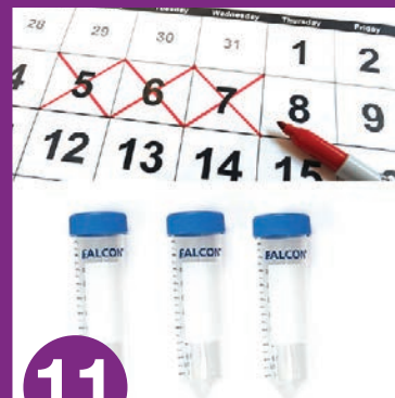
11 တစ်နေ့လျှင် မြွန် ၁ မြွန်၊ ၃ ရက်ကြာ စုယူပါ