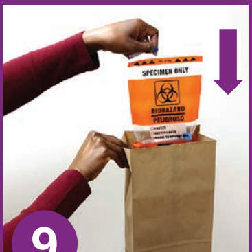
9 ပလတ်စတစ်အိတ်ကို စက္ကူအိတ်တွင် ထည့်ပါ