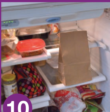
10 စက္ကူအိတ်ကို ရေခဲသေတ္တာ တွင် ထည့်ပါ