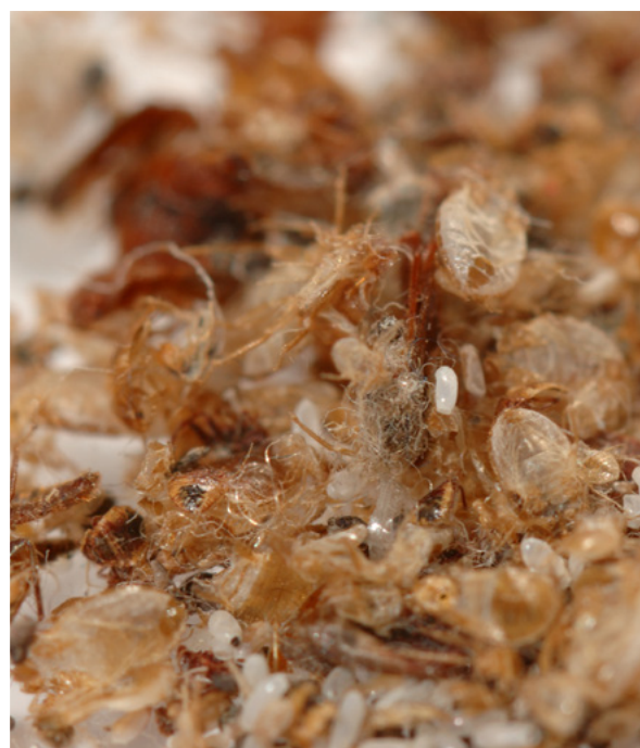
Vỏ rệp lột xác