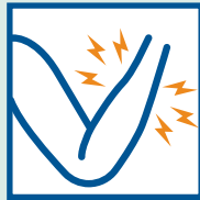
Đau cơ hoặc cơ thể