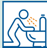
Buồn nôn hoặc nôn ói