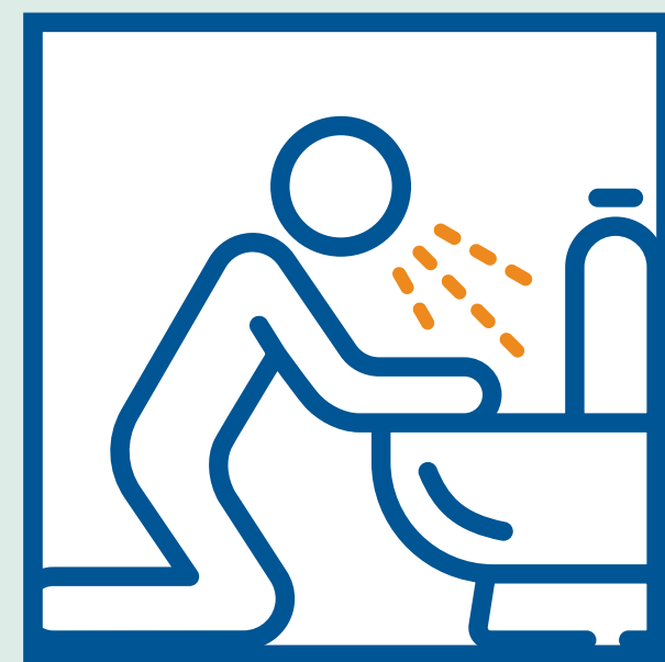
Buồn nôn hoặc ôn ói