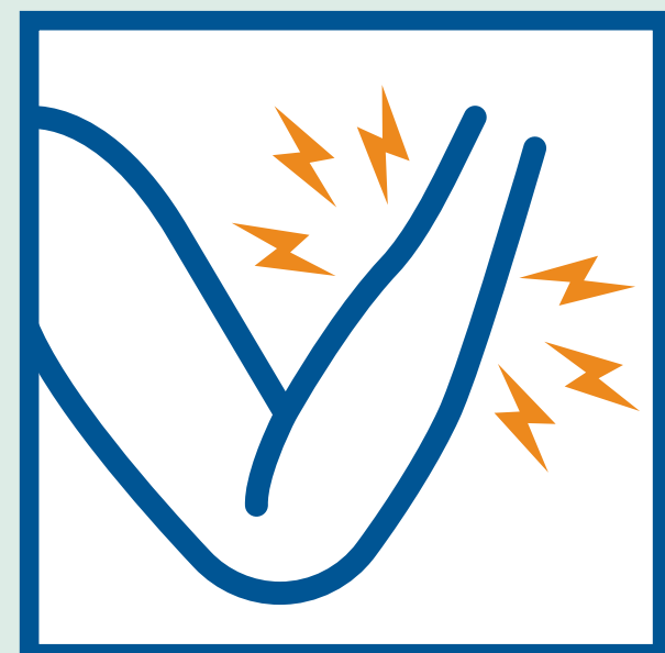
Đau cơ hoặc cơ thể