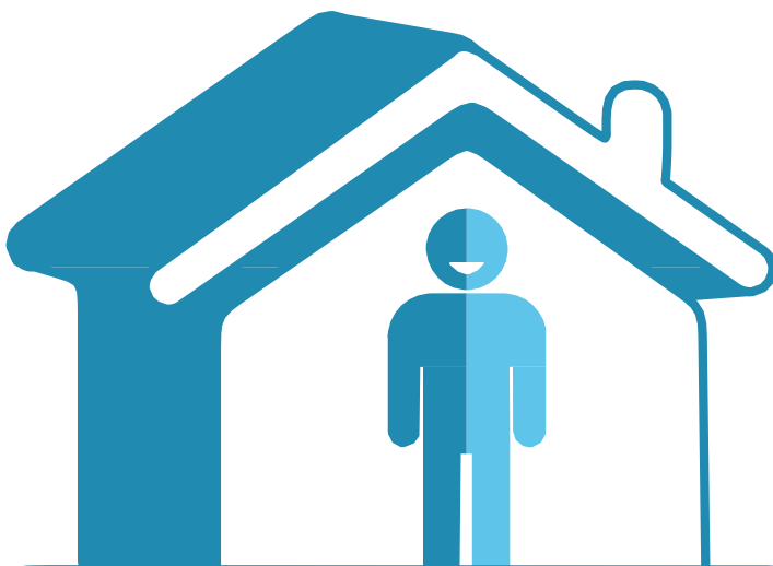
Người dưới sự giám sát (Persons Under Monitoring, PUM) Không có triệu chứng