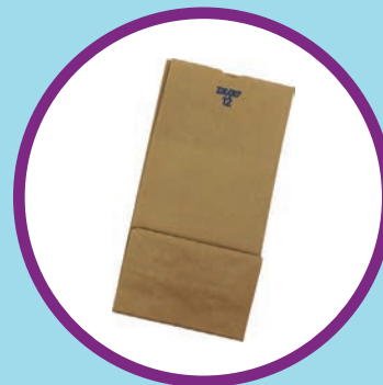
Một túi giấy