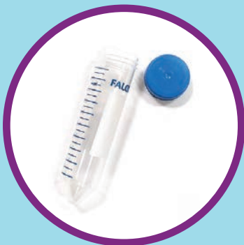
Một ống hút