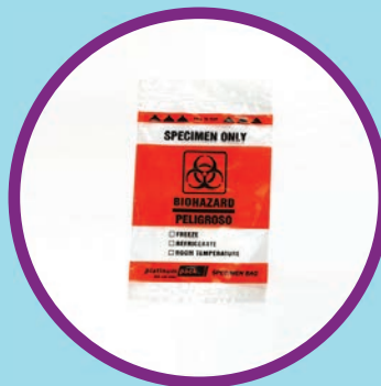
Một túi nhựa